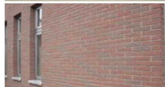
2階(上)と1階(下)の外壁仕上げの様子