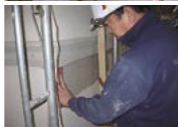
ベースコートの施工(上)と疑似タイルを貼り付けているところ(下)