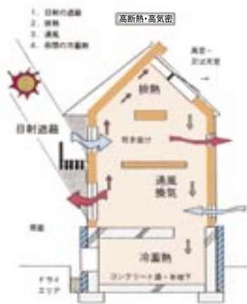
防暑対策を施した住宅の例

このように防暑対策をしっかりと施した高断熱・高気密住宅であれば、本州でも夏の暑い時期にいくつものクーラーを付けっ放しにする必要はなく、冷房日数・使用電力量とも削減することが可能になります。