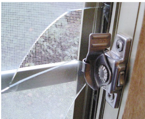
空き巣に割られた窓ガラス。ユーザーの命と財産を守るには、よりいっそうの防犯・防災対策が必要になる

快適性・省エネ性・耐久性の向上に加え防犯・防災対策と、住まいへの要求は年々その数を増してきますが、それらの要求にきちんと応えられるかどうかでビルダーが評価される時代が、もうすぐそこまで来ているのかもしれない。