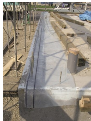
基礎断熱でパッキン付き先張りシートを基礎天端に施工している現場。この後土台を敷いて最終的に外壁の防湿・気密シートと連続させる

先張りシートを基礎天端と土台の間に挟む方法が主流です。基礎断熱材と布基礎の間に挟んで立ち上げた先張りシートを土台の下または上に通して1階外壁の防湿・気密シートと連続させる方法もあります。この場合、土台の下に通すなら防湿・気密シート、土台の上に通すなら透湿・防水シートを使