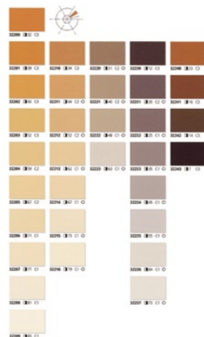
シュトー社のカラーチャートの例。使いやすく、施工に関する様々な情報もわかるようになっている

れて、そこに住んでいる人の90%以上の人も建物が特別なものになったと答えてくれた。