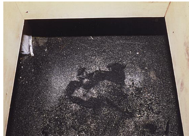
ヤシ殻活性炭を敷設し、床下空間の調湿・消臭を行っている住宅

これらの効果を研究や実験などにより証明したケースはまだまだ少ないようですが、日本では古来から経験則として木炭の効果を認識しており、畑作などで土壌改良材として使われていたり、湖沼で水質改良材として使われていたりしました。また、炭で焼いた魚や炭を入れて炊いたご飯が美味しいのは多くの人を知るところであり、これは木炭の遠赤外線効果が発揮された好例です。