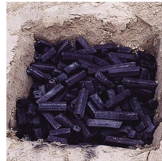
木炭を敷地に埋めて磁場を改善する埋炭を行った現場

木炭の効果は経験的に語られることが多く、公的な研究データは少ないのですが、先人の知恵を現代の住宅に取り入れてみるのも考え方の1つではないでしょうか。