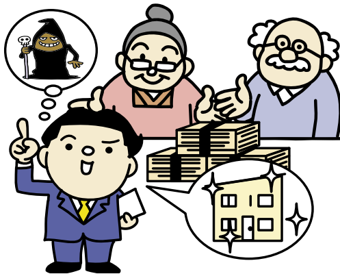
高齢者等を狙った悪質リフォームによって、住宅・リフォーム業界に対するユーザーの信頼が薄れつつある

ユーザーが安心してリフォームを行える環境を創ることが、業界や業者の利益につながります。こういう時だからこそ、しっかりした対応でユーザーの信頼を得たいものです。