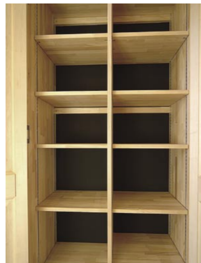
奥の壁に木炭塗料を塗った下駄箱

地球は北極をN極、南極をS極とする磁石であり、地上には地電流が地表から地中に流れるイヤシロ地と、逆に地電流が地中から地表に流れるケ