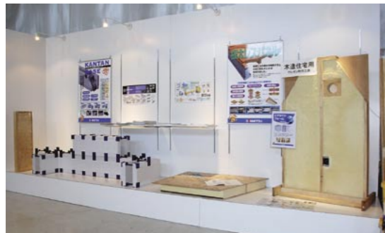
第2工場内にある製品展示ブース。各種パネル製品やかんたんベースは第1工場建設がきっかけとなって誕生した

精度の向上を目指したパネル製品は、「大工の減少や使用する木材・建材の変化に対応できるものを」という市場の声から生まれたものです。ハウスメーカー・工務店様やエンドユーザー様からの要望が仕事になっているのです。ですので、どういう発想でいろいろな事業をやっているのかとよく聞かれるんですが、実は何もないんですね。