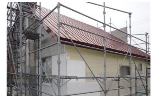
そとだんパネルはビス・ワッシャーで躯体のブロックに留め付けている

ダンネットでは、国交省の「平成20年度既存住宅・建築物省エネ改修緊急促進事業」に採択された『そとだんパネルによる断熱改修』を北海道内で開始。先頃、札幌市内で築35年になる補強コンクリートブロック造の住宅の施工現場を公開し、訪れたユーザーに暮らしたまま施工できる外張り断熱改修のメリットや塗り壁仕上げの良さなどをアピールしました。