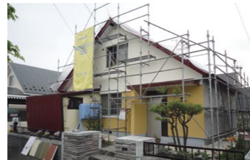
札幌市厚別区の築35年になる物件。建物正面をトップコートで仕上げたところ