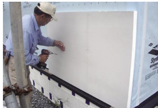
今後はそとだんパネルを使った断熱改修に力を入れていく

また、これからも夢を持ち続けていきたいですね。夢がなかったら30年続きません。常に高いレベルを目指して夢を追い続けていくことで、従業員も仕事にやりがいを感じ、モチベーションが上がっていくのではないのでしょうか。夢を持って初志貫徹する精神力と行動力があれば、自然に周囲が評価し、認めてくれると考えています。